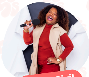
Peggy Civil Communications